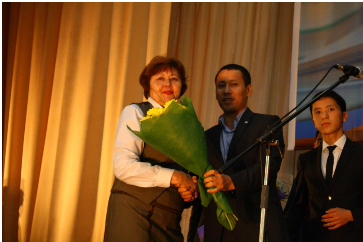
День учителя 2015