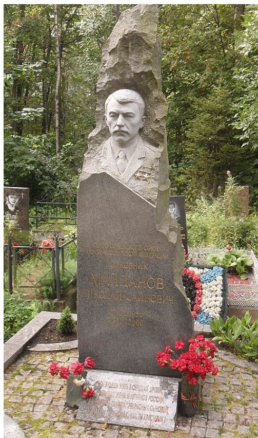
Санкт-Петербурктегі Серафимовский зиратының Батырлар аллеясындағы ескерткіштер