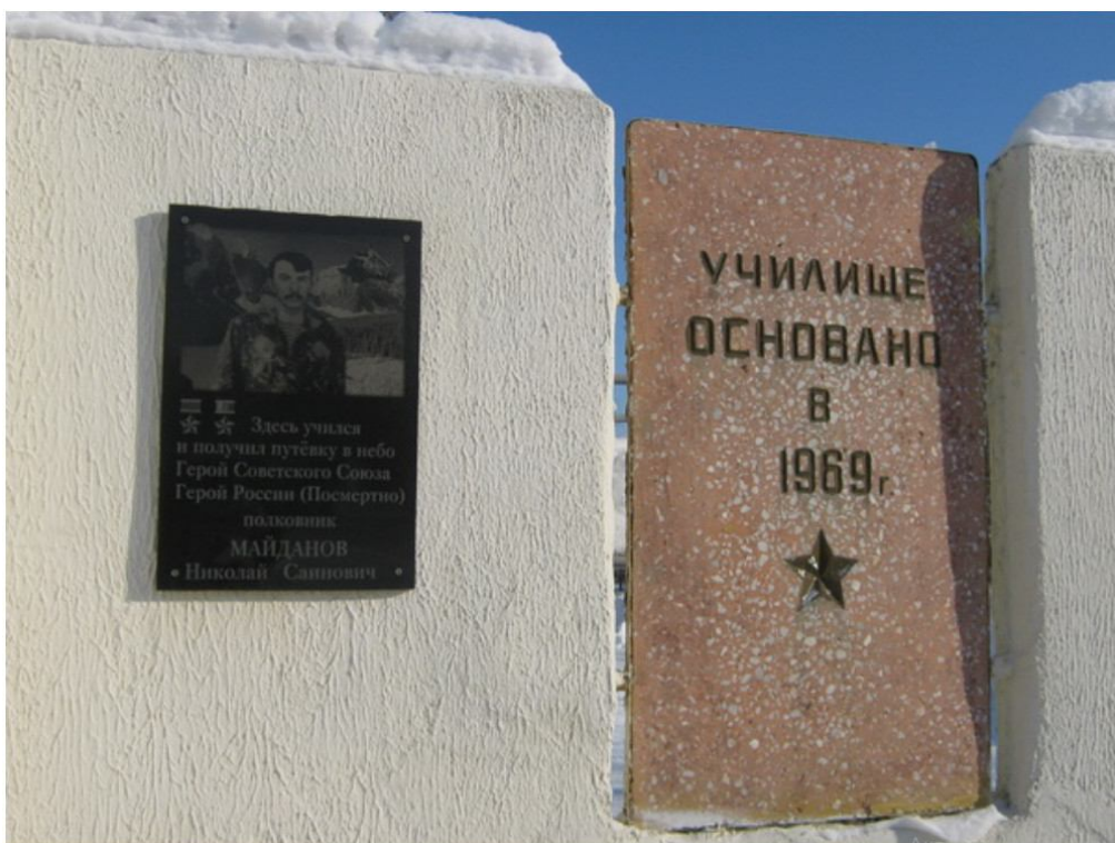
Саратов ұшу мектебінің ғимараты