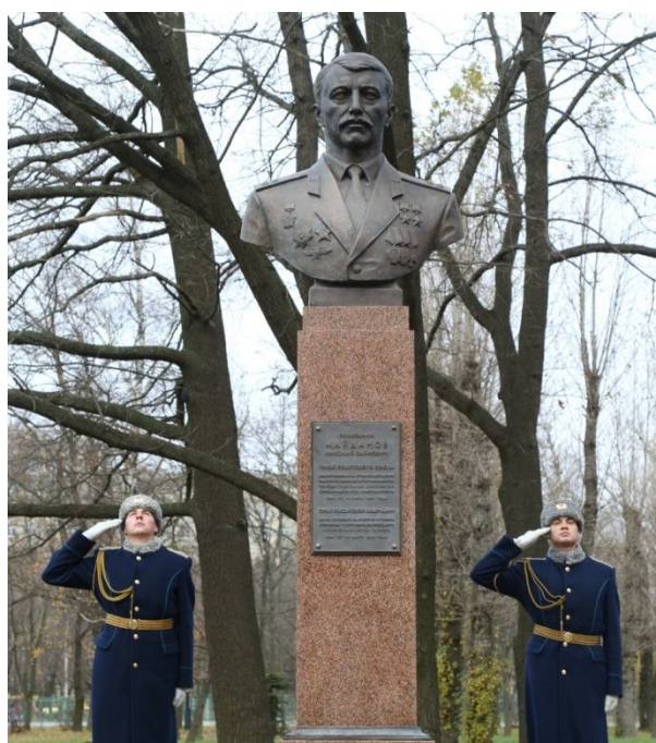
Санкт-Петербургтегі Мәскеу Жеңіс саябағындағы Батырлар аллеясындағы бюст