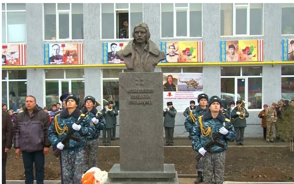
Оралдағы Әбілқайыр хан көшесіндегі әскери-техникалық мектептің жанында