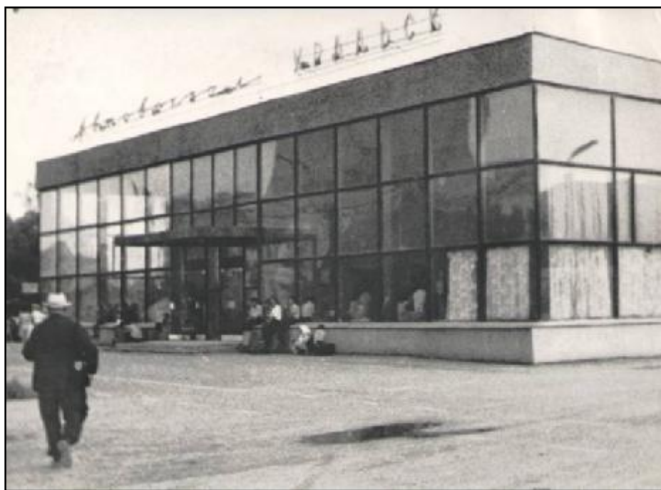
Сурет 4 – Ескі автобекет ғимаратының көрінісі [3]

2000 жылға дейін Қалалық электр көлігінің жолаушылар тасымалдау көлемі жыл сайын төмендеді. Бағыттардың төселген желілерге қосылуы жолаушылар ағынын автокөлік пайдасына қайта бөлудің негізгі себебі болды. Соңғы уақытта трамвайларда жол жүру құнының тұрақтылығы, қалалық автокөліктердегі билеттер бағасының бір уақытта өсуі қалалық электр көлігінде жолаушылар тасымалы көлемінің өсуіне әкелді. Бүгінгі таңда трамвай қызметі-қоғамдық көліктің ең қолжетімді түрі. Ағымдағы жылдың 9 айында 9.8 млн. жолаушы тасымалданды, бұл 1999 жылдың қаңтар-қыркүйегіне қарағанда 27.8%-ға артық.