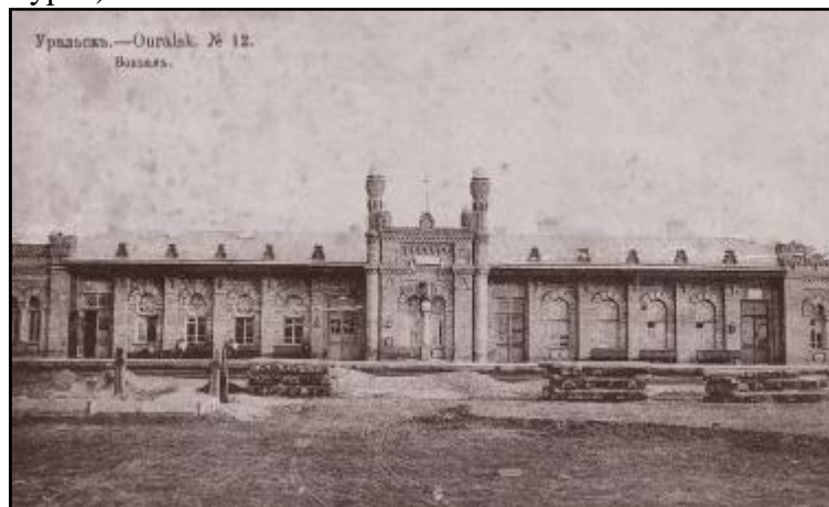
Сурет 1 – Орал қаласындағы вокзал ғимараты [3]

маңында мейрамханасы бар станция өсті. Алғашқы үш және алты пәтерлі барактар – Оралдағы жаңа мамандығы – теміржолшылар жұмысшыларына арналған үйлер салынды. Бұл үйлер бүгінгі күнге дейін Вагон мен Кооперативная көшелерінің қиылысында тұр (1-сурет).