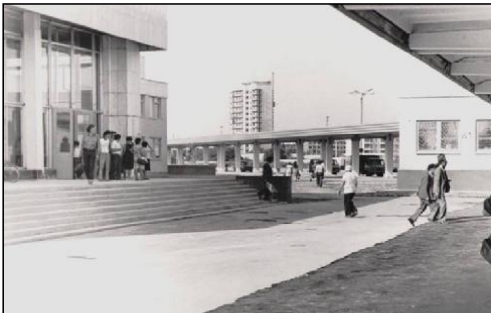
Сурет 5 – Жана автобекеттің ішкі көрінісі, 1982 жыл [3]

Қоғамдық көліктердің пайда болуын бір ғана Орал қаласының тарихи фотоларынан да көруге болады. Қоғамдық көліктер азаматтарды тасымалдауда маңызды рөл атқарды. Архив қорындағы фотоқұжаттардан байқағанымыздай Орал