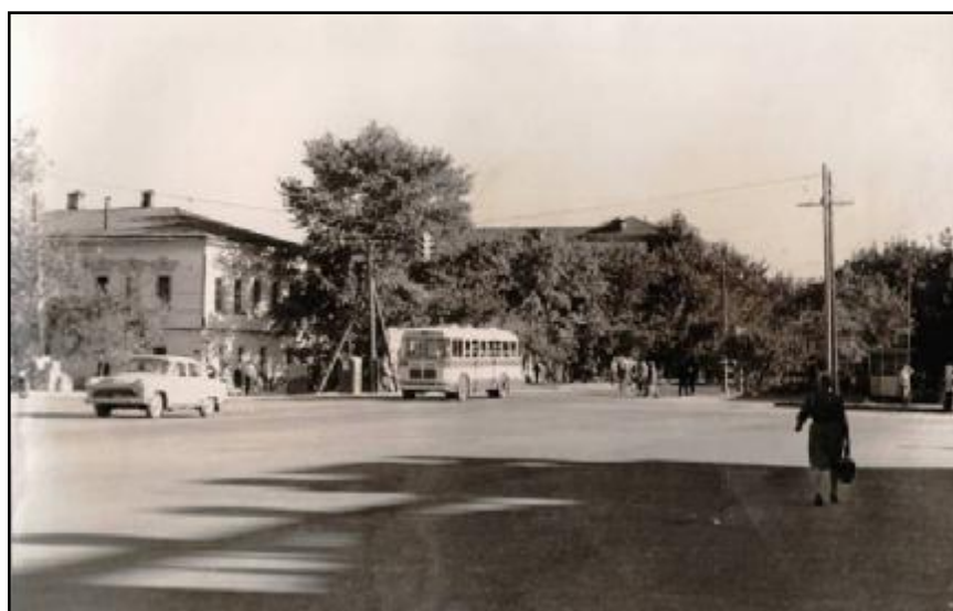
Сурет 2 – Бұрынғы В.И. Ленин атындағы даңғыл [3]

Батыс Қазақстан облыстық Мемлекеттік архивінде «Старый Уральск» фотокөрмесінде өлкедегі байланыс көлік-құралдарының пайда болуына байланысты суреттер мен фотоқұжаттарды табуға болады.