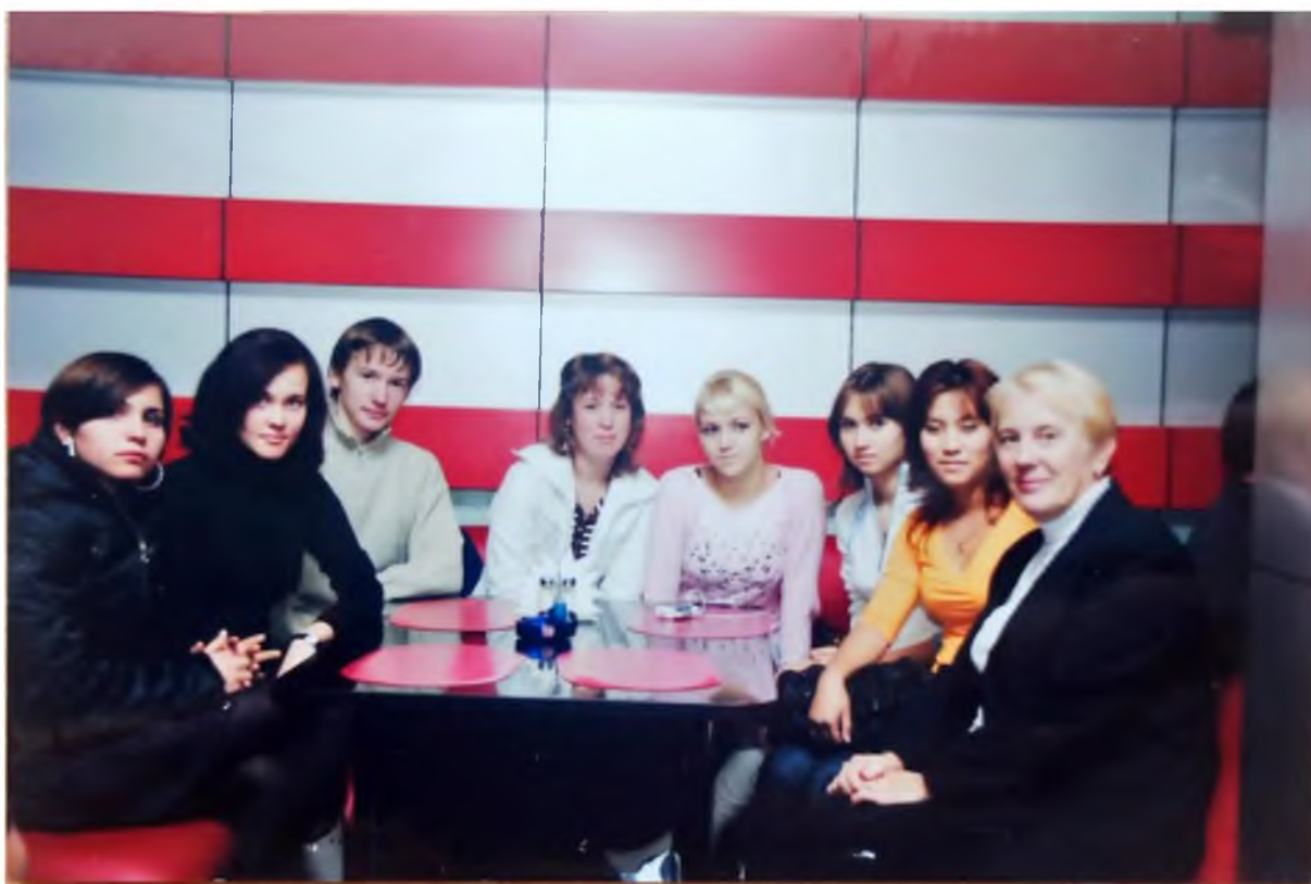
Последняя группа кураторства 2007-2011