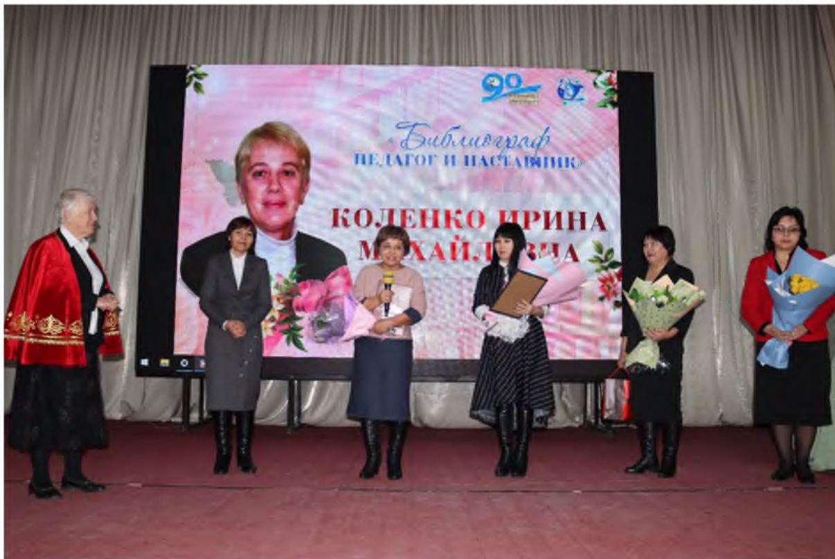
Поздравления от директоров библиотек города Уральск