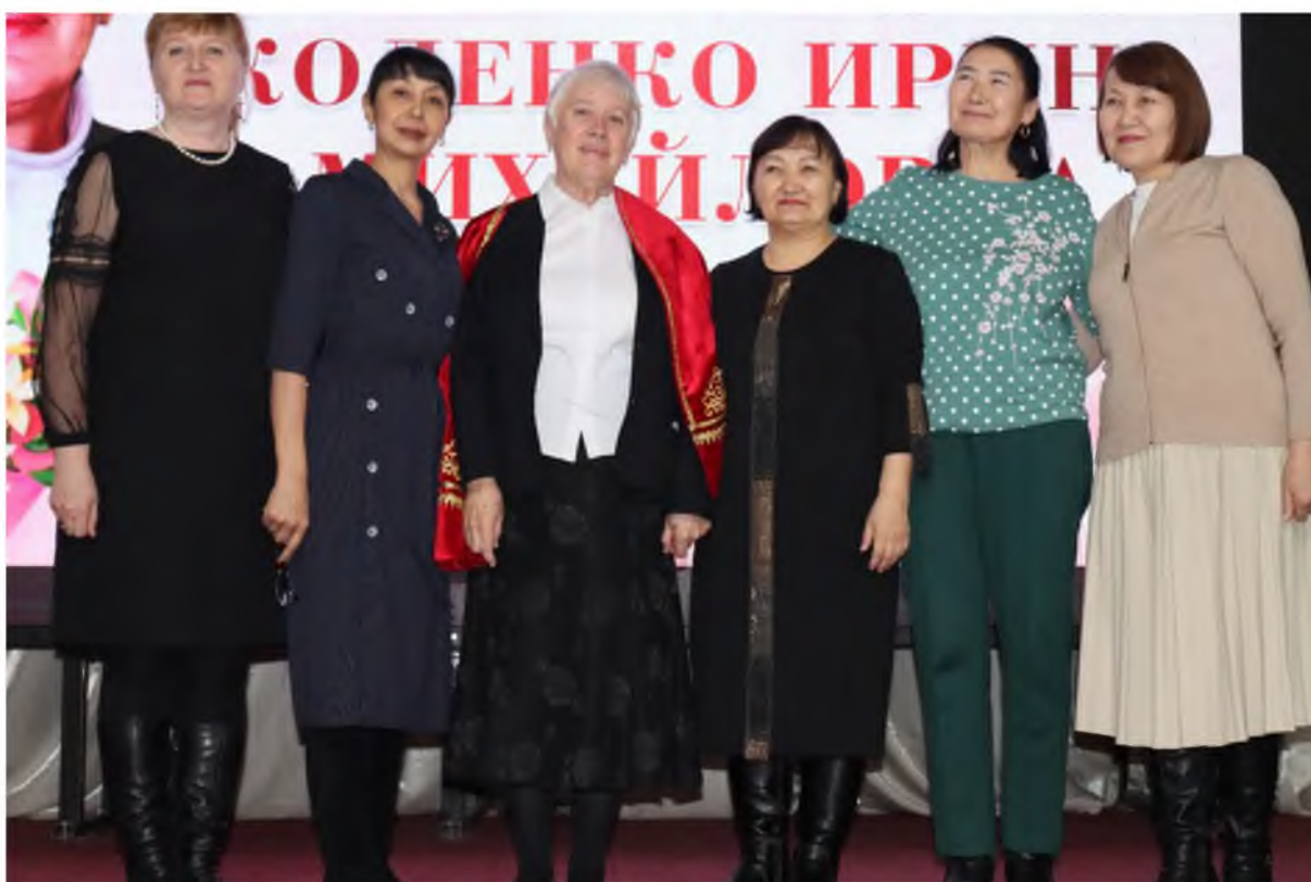
Поздравления от выпускников