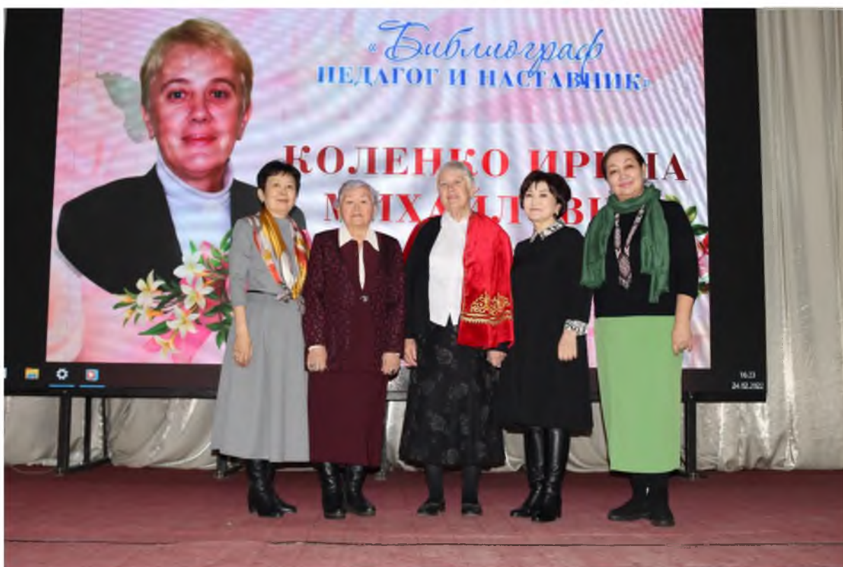
Поздравления от ветеранов библиотечного дела