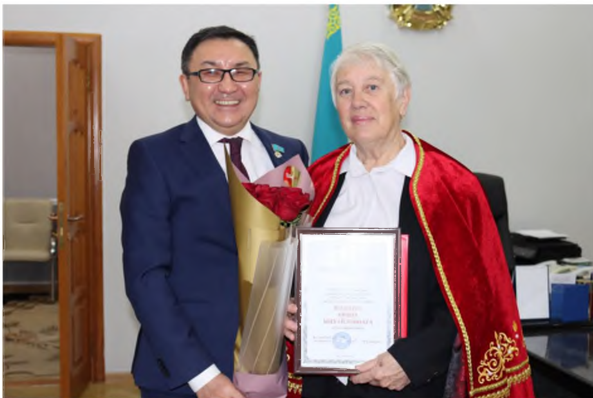
Поздравление ректора с 70-летним юбилеем 24 февраля 2022 года