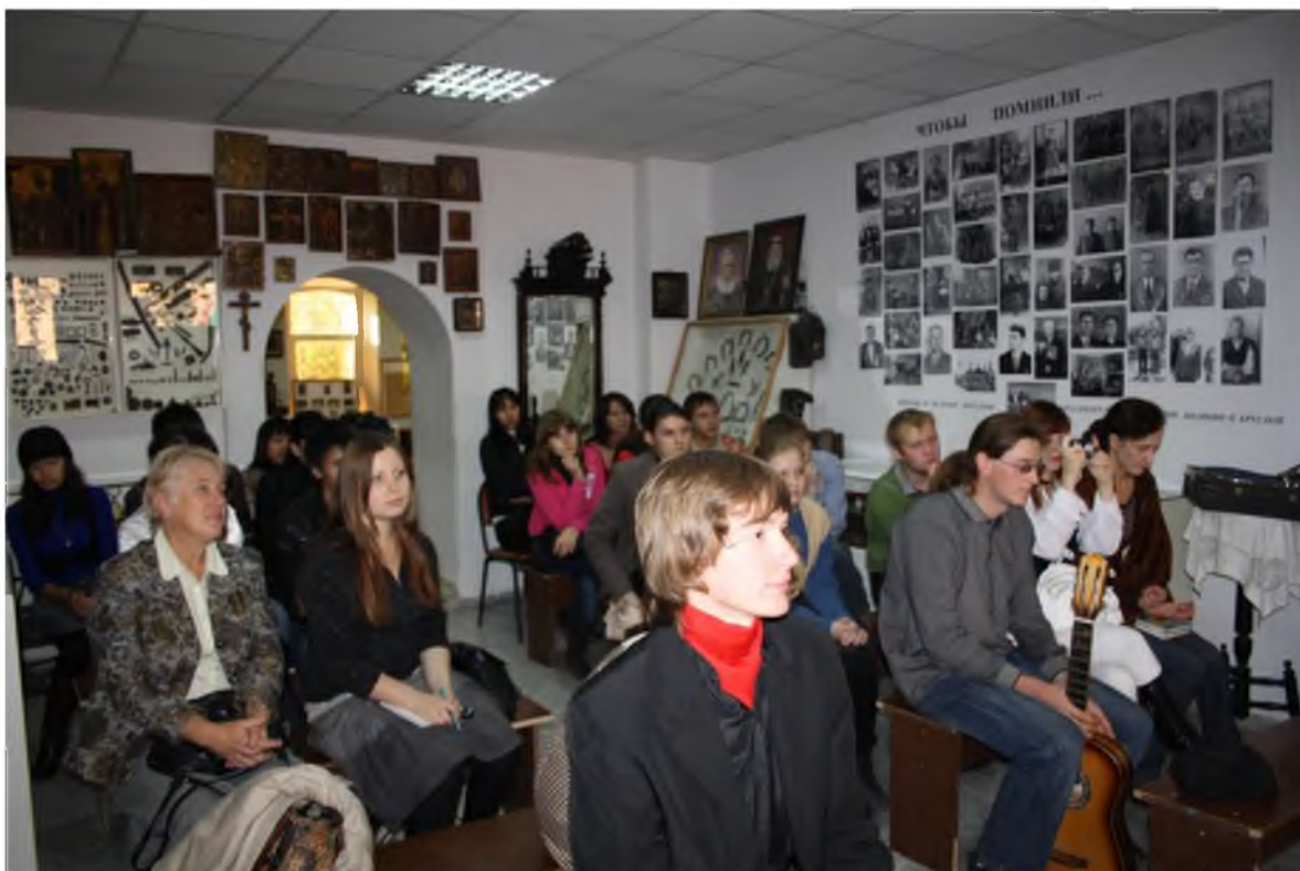
Литературный салон «Свеча». (с группой 2007-2011 годов обучения)