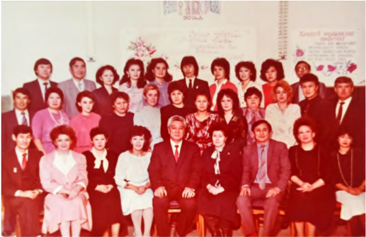
Первая группа кураторства в вузе. Выпуск 1996 года