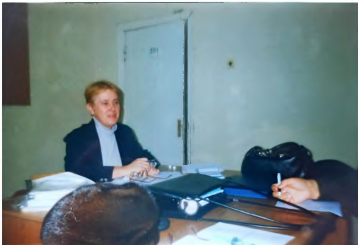
Работа в вузе

Актобе, 2003 г. Филиал заочного отделения