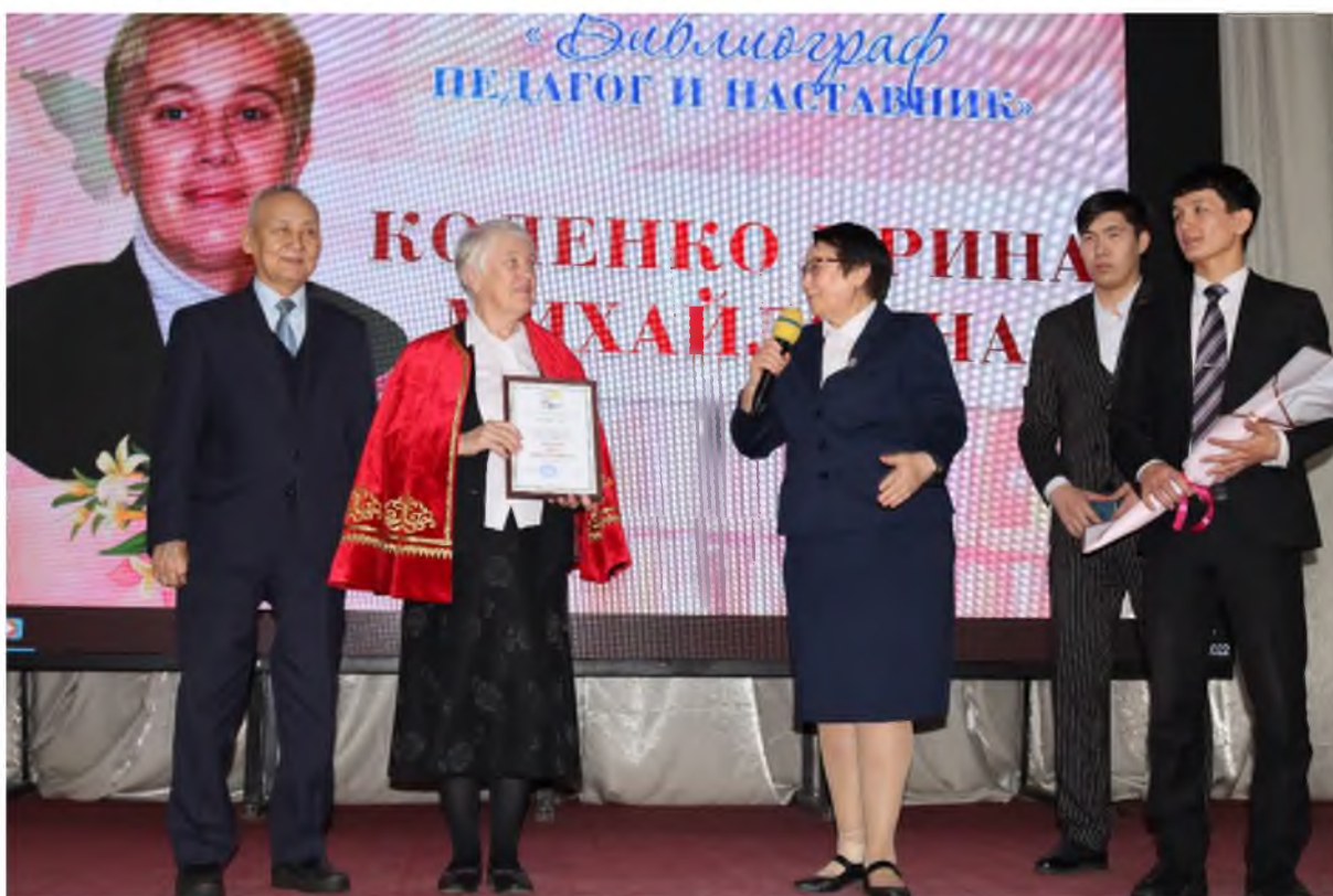
Поздравление с юбилеем