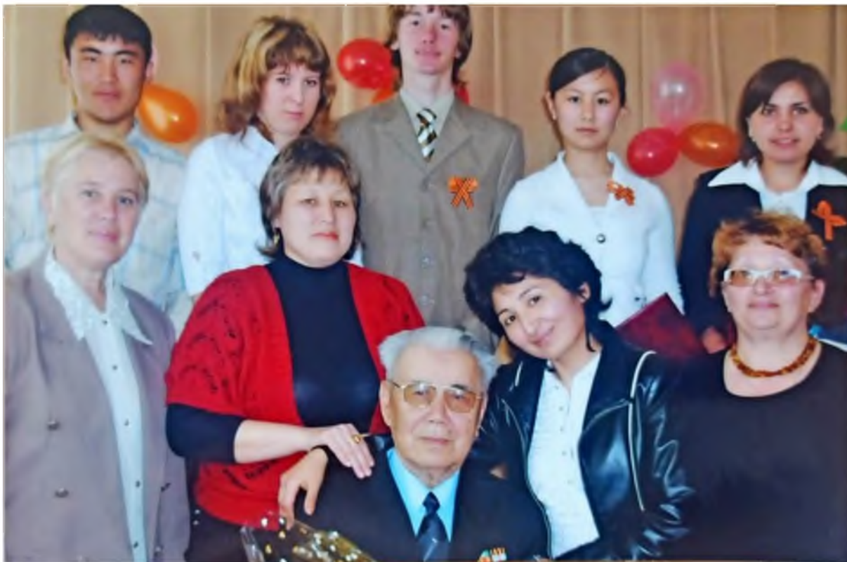
Связь с библиотекой не теряла никогда