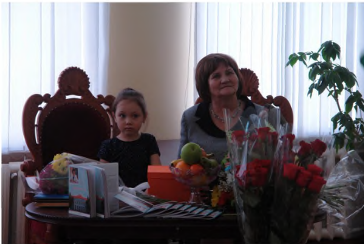
Поздравление с 70-летием. 2017 г.