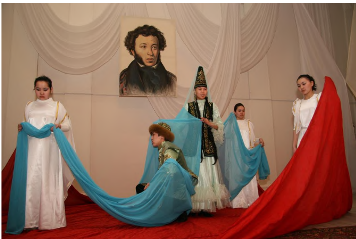
Козы Корпеш и Баян сулу, сценка