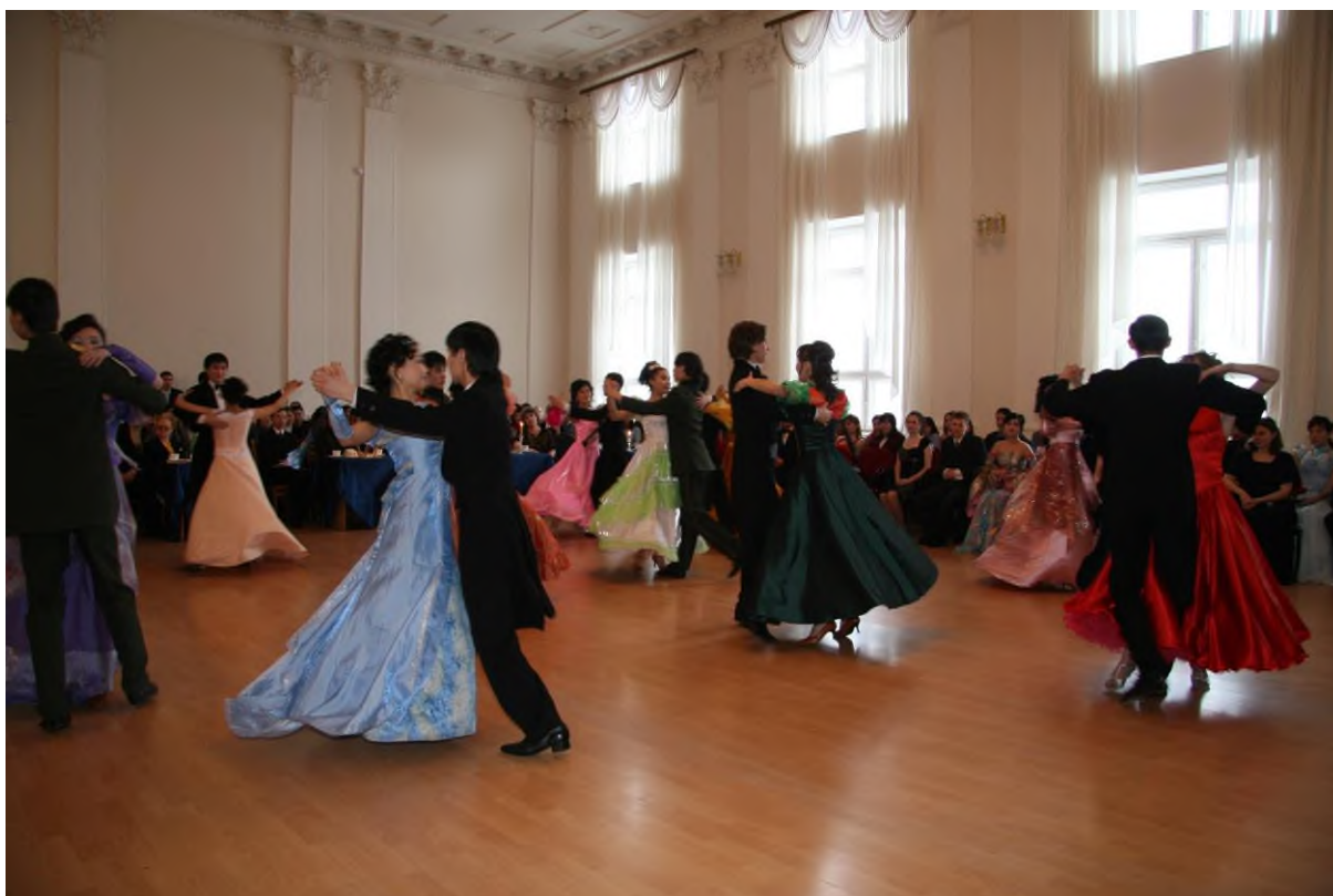
Пушкинские балы. 2007, 2008, 2009