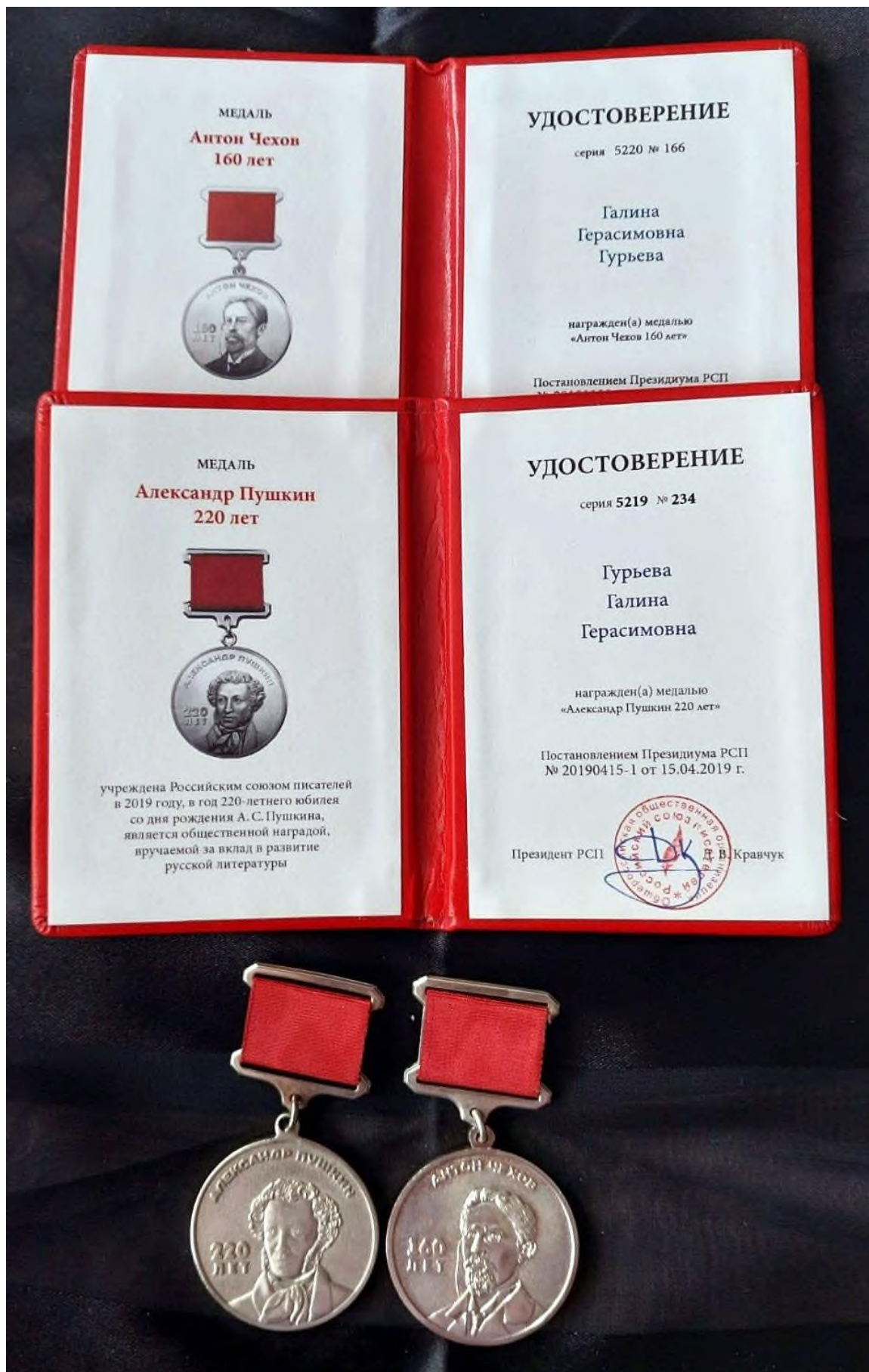
Награды от Российского Союза писателей