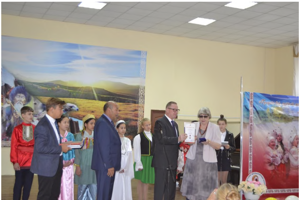
Вручение Пушкинской медали