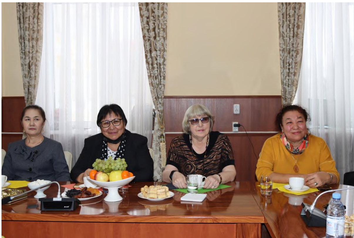
Празднование Международного женского дня