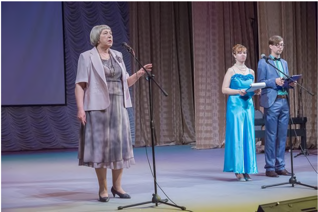
Презентация книги «Летит столетье над Уралом» в театре им. Островского