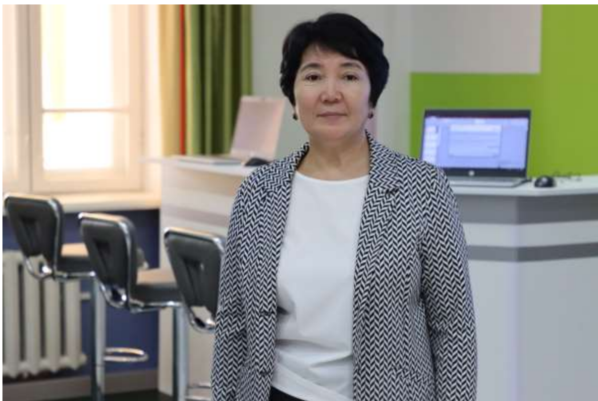
Коворкинг-центр «Jastar live»